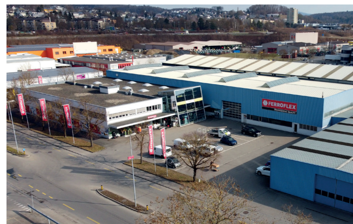
Standort Schaffhausen Einer von schweizweit elf Standorten der FERROFLEX Group